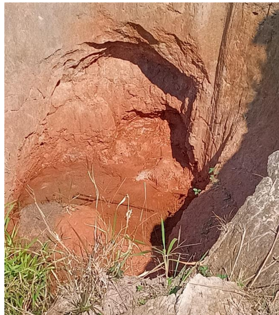
Nascente 08 -23°31'07.73"S/-54°04'56.14"O