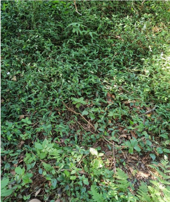
Nascente 05 -23°27'56.96"S/-53°59'48.89"O