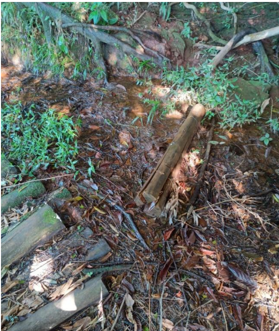
Nascente 07 -23°27'57.73"S/ -53°59'49.60"O