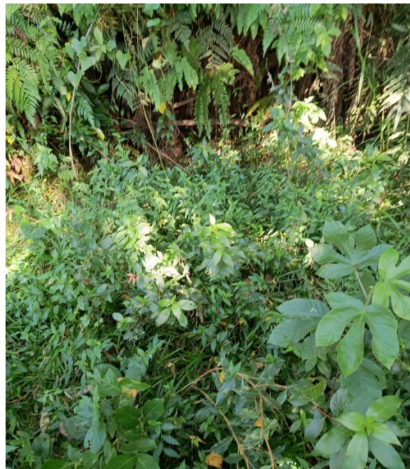
Nascente 06 -23°27'55.66"S/-53°59'49.43"O