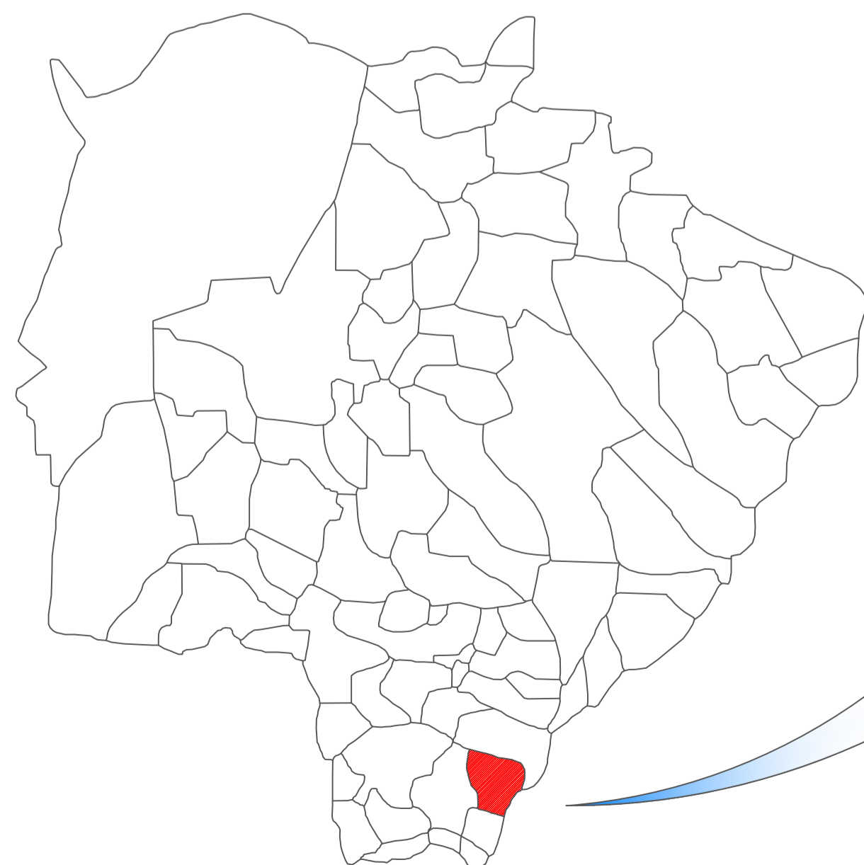
MAPA DO MATO GROSSO DO SUL SEM ESCALA