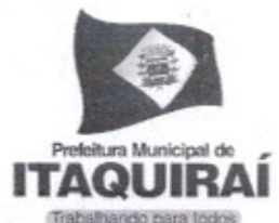
RICARDO FÁVARO NETO Prefeito Municipal

Gabinete do Prefeito Municipal de Itaquirai MS, 26 de Julho de 2017.