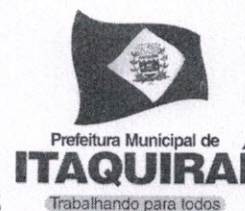
Ricardo Fávaro Neto Prefeito Municipal

Gabinete do Prefeito Municipal de Itaquirai MS, 21 de Novembro de 2017.