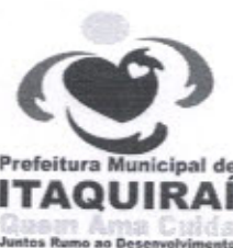
RICARDO FAVARO NETO Prefeito Municipal

Gabinete do Prefeito Municipal de Itaquirai MS, 27 de Março de 2014.