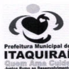
RICARDO FÁVARO NETO Prefeito Municipal

Gabinete do Prefeito Municipal de Itaquirai MS, 07 de Maio de 2013.