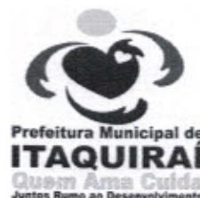
Ricardo Favaro Neto Prefeito Municipal

Gabinete do Prefeito Municipal de Itaquiraí MS, 04 de Novembro de 2013.