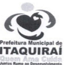
RICARDO FAVARO NETO Prefeito Municipal

Gabinete do Prefeito Municipal de Itaquirai -MS, 11 de Fevereiro de 2014.