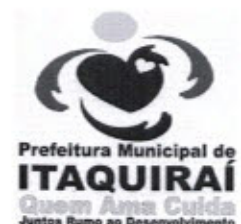
RICARDO FAVARO NETO Prefeito Municipal

Gabinete do Prefeito Municipal de Itaquiraí MS, 11 de Junho de 2013.