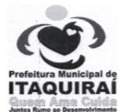
RICARDO FAVARO NETO Prefeito Municipal

Gabinete do Prefeito Municipal de Itaquirai MS, 11 de Junho de 2013.