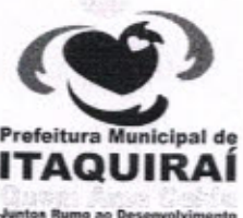
RICARDO FAVARO NETO Prefeito Municipal

Gabinete do Prefeito Municipal de Itaquirai MS, 05 de Abril de 2013.