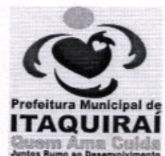
RICARDO FAVARO NETO Prefeito Municipal

Gabinete do Prefeito Municipal de Itaquiraí MS, 05 de Fevereiro de 2013.